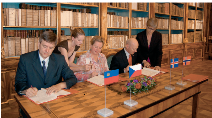
Slavnostní podpis Memorand o porozumění ve Filosofickém sále Strahovské knihovny, 16. června 2011. Zleva: Tomáš Zidek, náměstek ministra financí ČR, Maria-Pia Kothbauer, velvyslankyně Lichtenštejnského knížectví a Jens Eikaas, velvyslanec Norska.

Otevřené výzvy budou vyhlášeny zprostředkovatelem příslušného programu (viz tabulky), až po schválení jednotlivých programů donorskými státy, tedy nejdříve od poloviny roku 2012. Zprostředkovatelem pro většinu programů je Ministerstvo financí ČR, které je zároveň Národním kontaktním místem pro Finanční mechanismy EHP a Norska v České republice.